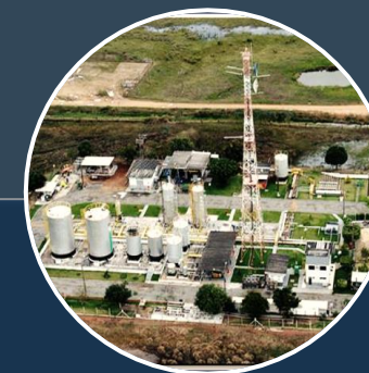
FELTKLYNGE NORTE CAPIXABA